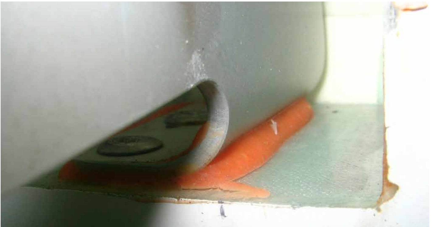
1) Immagine dell'affaticamento dell'incollaggio / Image of the fatigue fracture

The aircraft on which the fatigue signs has been found has a high number of flight hours and often flies at the borders of flight envelope limits with extended flaps.